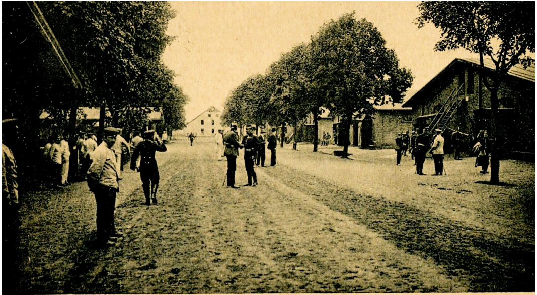
Gruss vom Truppenübungsplatz Friedrichsfeld. Wilhelmstrasse

Nach dem Auszug der Franzosen blieb das Barackenlager Friedrichsfeld bis 1920 Manöverunterkunft für auf dem Truppenübungsplatz eingesetzte preußische Soldaten. Nach dem Ende des Ersten Weltkrieges und der