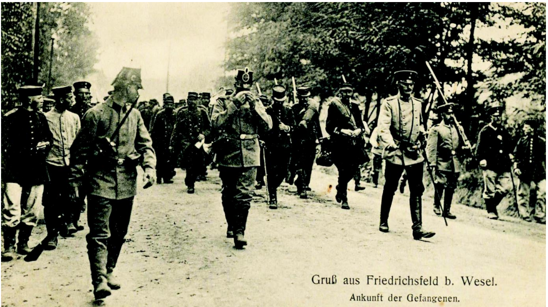
Gruß aus Friedrichsfeld b. Wesel. Ankunft der Gefangenen.

Auflösung des Militärstandortes erwarb 1921 die „Siedlungsgesellschaft für den Kreis Dinslaken GmbH“ den ehemaligen Militärbesitz und entwickelte in der Folge den zivilen Ort, das heutige Friedrichsfeld.