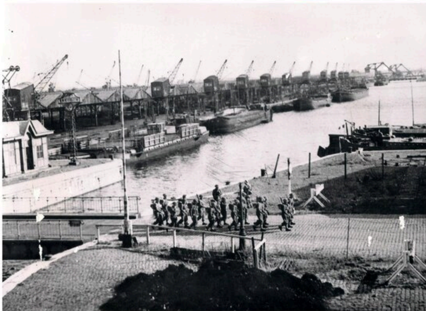
Poolse soldaten in het havengebied van Antwerpen