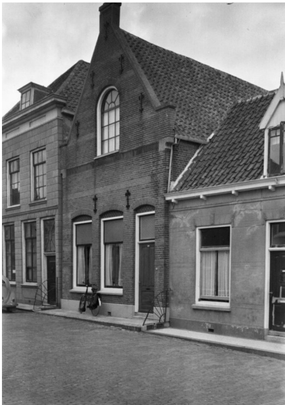
De voormalige synagoge aan de Meelstraat 55 (destijds B 46c) in 1962