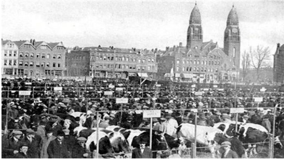
De Joodse Veemarkt

De Veemarkt in Rotterdam bestaat niet meer en was gevestigd aan de Goudserijweg / Hugo de Grootstraat, op de grens tussen Kralingen en Crooswijk. De markt is weg sinds 1973, nu zijn er woningen gebouwd en een van de huidige straten op dit gebied heet de Veemarktstraat. Blikvanger op het terrein was de Koninginnekerk aan de Boezemsingel. Deze kerk werd in 1907 in gebruik genomen en was genoemd naar koningin Wilhelmina. Opvallend waren de kopergroene daken van dit in de art-deco stijl ontworpen gebouw. Bij het bombardement werd een groot deel van deze buurt vernield, de Koninginnekerk werd niet getroffen.