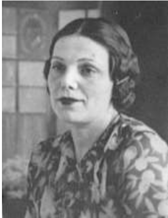
Romana in 1938.