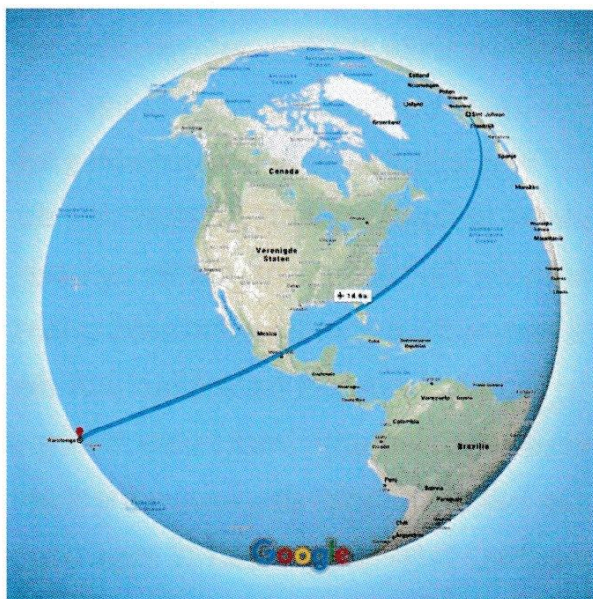
Rarotonga ligt ongeveer 16.400 km verwijderd van Sint Juliaan

Poperinge gebracht, maar hij stierf op de 8 e en is daar begraven.