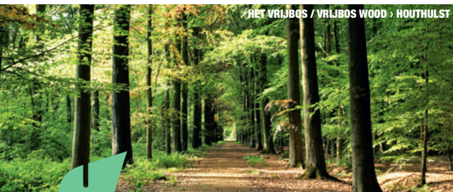
HET VRIJBOS / VRIJBOS WOOD › HOUTHULST