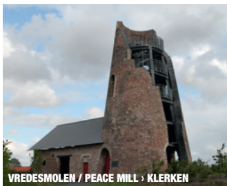
VREDESMOLEN / PEACE MILL › KLERKEN