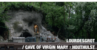
LOURDESGROT / CAVE OF VIRGIN MARY › HOUTHULST

Memorial Museum Passchendaele 1917, Bertin Pilstraat 5A, BE-8980 Zonnebeke T +32(0) 51 77 04 41 | W www.passchendaele.be | E info@passchendaele.be | E 14-18@passchendaele.be