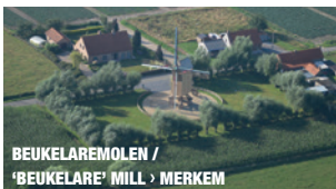
BEUKELAREMOLEN / 'BEUKELARE' MILL › MERKEM