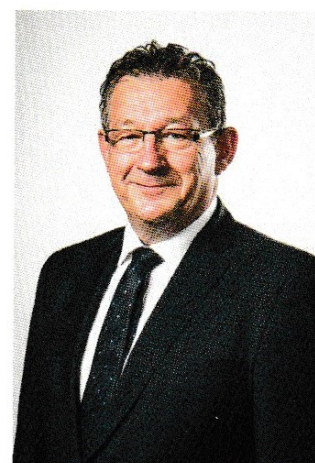
Dirk De fauw Burgemeester van Brugge

75 jaar na de heuglijke bevrijding van Brugge en het ommeland is het nog altijd belangrijk om stil te staan bij de oorzaken en gevolgen van oorlog. Jaarlijks herdenkt Stad Brugge verschillende episodes uit de Eerste en Tweede Wereldoorlog en we zullen dit blijven doen. Deze zwarte bladzijden uit onze wereldgeschiedenis moeten we in het collectieve geheugen blijven bewaren en de vele slachtoffers die toen vielen, verdienen een passend eerbetoon. Laten we tot slot ook de boodschap van vrede en verzoening blijven verkondigen en benadrukken, zodat de generaties die na ons komen geen oorlog hoeven mee te maken.