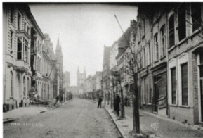
De Rijzelstraat na de granaotinslag van 12 november 1914.